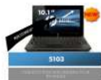
Aspects de 1,3 Kg